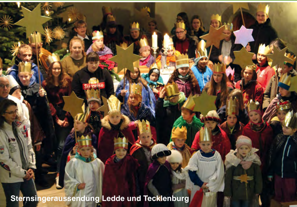
Sternsingeraussendung Ledde und Tecklenburg