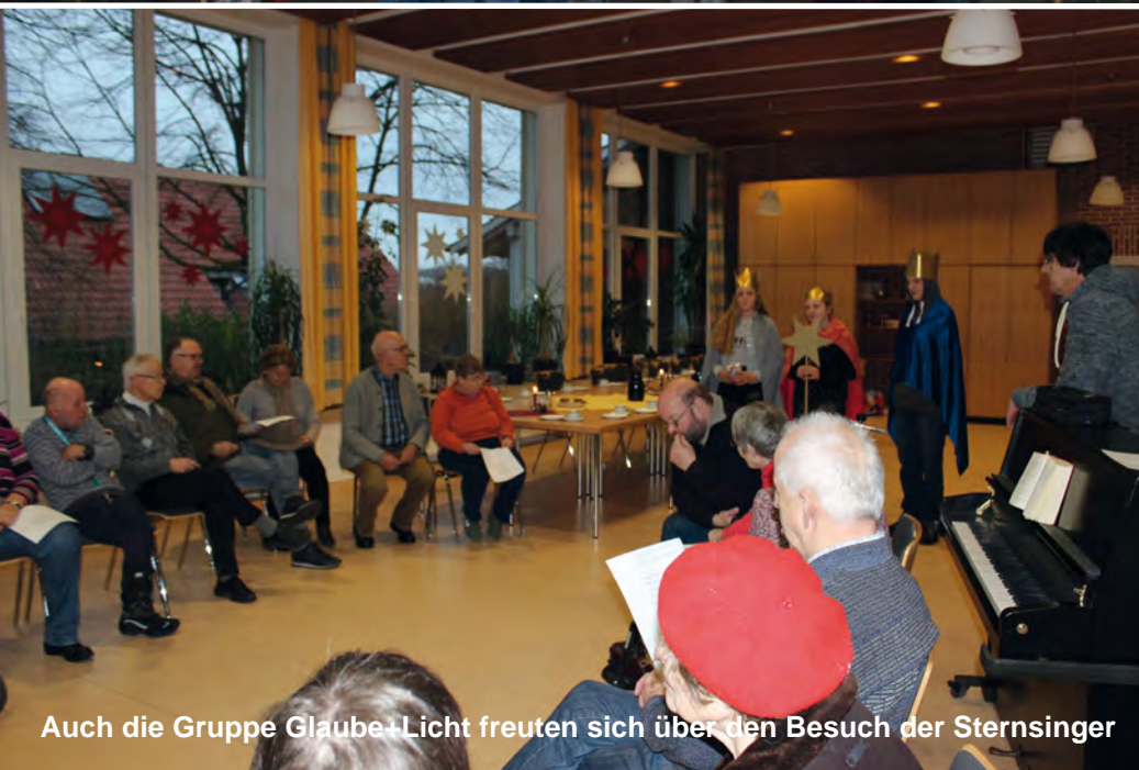
Auch die Gruppe Glaube+Licht freuten sich über den Besuch der Sternsinger

In diesem Jahr sammelten die Sternsinger für Kinder im Libanon unter dem Motto: Frieden! Im Libanon und weltweit. In der ganzen Region leisten Sternsinger hier einen vorbildlichen Beitrag. Sie werden von vielen Eltern und ehrenamtlichen Helfern in diesem ökumenischen Projekt unterstützt und an den Haustüren gerne gesehen und mit großzügigen Spenden bedacht. Insgesamt erbrachte die diesjährige Sternsingeraktion in Brochterbeck, Ledde, Leeden und Tecklenburg einen Gesamtbetrag von fast 16.000 Euro. Ein stolzes Ergebnis!