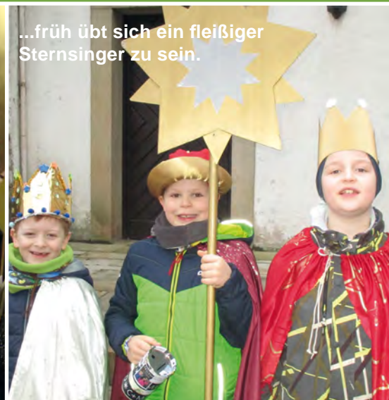
...früh übt sich ein fleißiger Sternsinger zu sein.